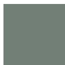
7001 GRIGIO ARGENTO