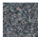
279 GRIGIO SCURO