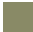
7034 GRIGIO GIALLASTRO