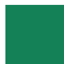
6017 VERDE MAGGIO