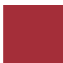
3016 ROSSO CORALLO