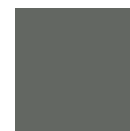
7037 GRIGIO POLVERE