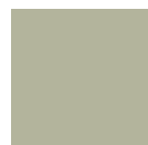
7032 GRIGIO GHIAIA