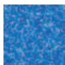
277 AZZURRO SCURO