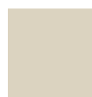
1013 BIANCO PERLA