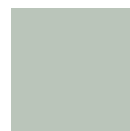
7035 GRIGIO LUCE