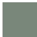
7030 GRIGIO PIETRA