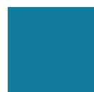
5024 BLU PASTELLO